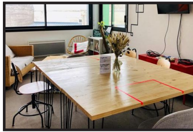
LA MOYENNE BLANCHE (25 m 2 )

Capacité : (12 personnes) 5 personnes* Équipements : écran TV, vidéoprojecteur, paperboard, système de visioconférence, tables, chaise