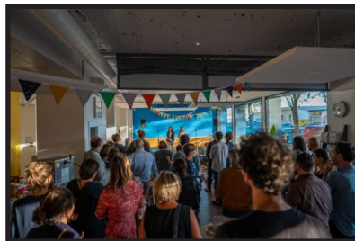
L'ESPACE CONFERENCE (110 m 2 )

Capacité : (100 personnes) 20 personnes* Équipements : espace modulable, tables, chaises, sonorisation, vidéoprojecteur