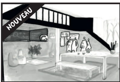
LA GRANDE VERTE (90 m 2 )

Cocktail.....à partir de 20 € HT / pers.