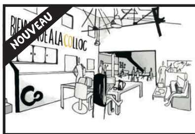
LE SALON (85 m 2 )

Capacité : (40 personnes) 20 personnes* Équipements : petite cuisine, bar, tables, chaises, salon