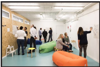
L'ATELIER (55 m 2 )

Capacité : (20 personnes) 10 personnes* Équipements : espace modulables, chaises, tables, paperboard, vidéoprojecteur